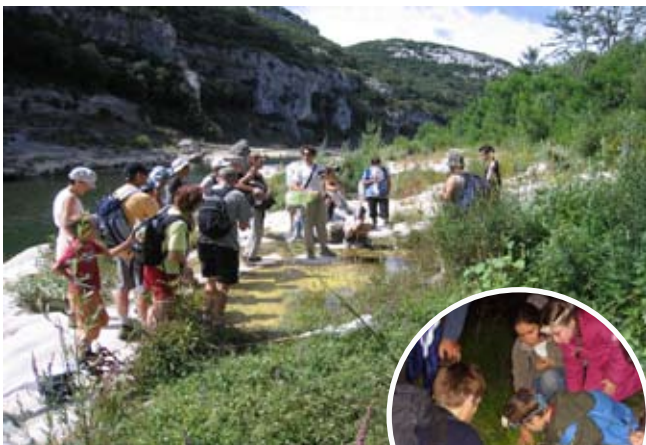
Rondleidingen worden georganiseerd om u het gebied met zijn erfgoed te laten ontdekken : inlichtingen kunt u verkrijgen bij het Conservatoire des Espaces Naturels du Languedoc-Roussillon.

Door de talrijke overblijfselen die getuigen van zeer vroege menselijke aanwezigheid in het gebied kunnen pedagogische activiteiten worden georganiseerd rondom de interpretatie van de landschapen met betrekking tot de menselijke activiteiten.