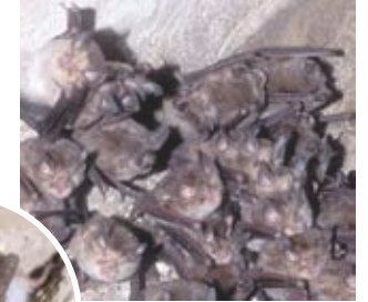
Zwerm van paarse hoefijzerneus

• Tien soorten vleermuizen gebruiken de grot van de Baume Saint-Vérédème, om zich voort te planten of te overwinteren. Onder hen vinden we de zeldzame en bedreigde Schreibers' vleermuis, de Capaccini's vleermuis en de paarse hoefijzerneus.