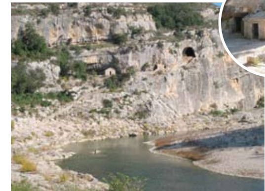
Ermitage Saint Vérédème en de ingang van de grot

In het reservaat vinden we verscheidene overblijfselen die getuigen van de oudheid en de voortgang van menselijk bestaan in het massief : de grot van de Baume Saint-Vérédème die bezet is sinds het boven-paleolithicum (-30000 jaar), menhirs en oppidum, ermitage Saint-Vérédème (Xe eeuw), steenkool en kalkovens (tot de XIXe eeuw).